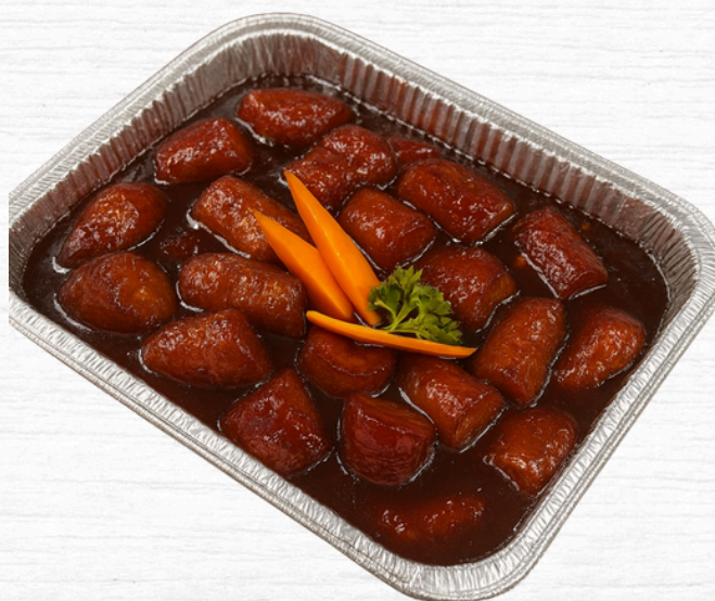
BANDEJA DE PLÁTANO EN TENTACIÓN

10 personas x $6.50 20 personas x $12.00 50 personas x $30.00